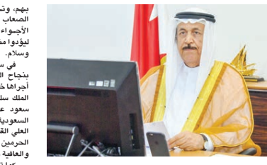
رئيس المجلس الأعلى للشؤون الإسلامية