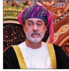
السلطان هيثم بن طارق آل سعيد

أمر صاحب السمو الملكي الأمير خليفة بن سلمان آل خليفة رئيس الوزراء المؤقت، وزارة الصحة بتشديد الرقابة على عمليات صرف الأدوية في الصيدليات الحكومية والخاصة بمختلف محافظات المملكة، والتأكد من مدى اتباعها للأنظمة القانونية المعمول بها، وبما يسهم في الحد من صرف الأدوية بغير وجه حق أو بدون وصفات طبية. وشدد سموه على أهمية عدم التساهل في أي أمر يتعلق بصحة وسلامة المواطنين والمقيمين، مع تشديد الرقابة على مخازن الأدوية، والتأكد من اشتراطات التخزين والبيع ومراقبة الأدوية المخدرة والأدوية الخاضعة للرقابة، وبما لا يترك مجالاً لضعاف النفوس للتلاعب بها لتحقيق مكاسب غير مشروعة على حساب صحة وسلامة أفراد المجتمع.