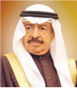
سمو رئيس الوزراء