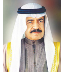
سمو رئيس الوزراء

وجه سموه إلى تشكيل لجنة من ذوي الاختصاص لمراجعة القوانين والإجراءات التي تحكم آليات صرف الأدوية بالصيدليات الحكومية والخاصة، وتغليظ العقوبات على المخالفين والتأكد من مدى الالتزام بالاشتراطات الواردة في القوانين المنظمة لمزاولة مهنة الصيدلة والمراكز الصيدلانية، ورفع تقريرها إلى مجلس الوزراء، وباتى هذا الأمر في إطار ما يوليه صاحب السمو الملكي رئيس الوزراء من اهتمام بالرعاية الصحية وتحقيق أعلى مستويات الجودة المقدمة للمواطن والمقيم، والحرص على الالتزام بالقوانين والبروتوكولات التي تنظم عمليات صرف الأدوية بما لا يدع أي مجال للاستغلال أو التربح وهدر الأموال العامة المخصصة لشراء الأدوية.