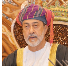
سلطان سلطنة عمان