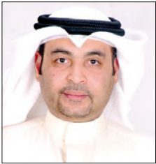
د. رابيد خليفة

أكد الدكتور وليد خليفة المانع وكيل وزارة الصحة عضو الفريق الوطني الطبي للتصدي لفيروس كورونا (كوفيد-19) على ضرورة المواصلة بعزم وإصرار ومسؤولية من قبل كل فرد من أفراد المجتمع خلال فترة عيد الأضحى المبارك والاستمرار بالالتزام بالإجراءات الاحترازية والتدابير الوقائية للحد من انتشار الفيروس وتقليل نسب ومعدلات الإصابة الناتجة عن المخالطة وتجنب ارتفاع عدد الحالات بعد العيد كما حدث في عيد الفطر بسبب التهاون في التطبيق السليم للتعليمات الصادرة من الجهات المعنية. وأكد الدكتور وليد المانع بأن المسؤولية خلال هذه المرحلة تتطلب عزم وتكاتف الجميع عبر الالتزام بالقرارات والإجراءات الاحترازية لتجاوز هذه الجائحة وأثارها وحماية الفرد وأفراد أسرته، منوهاً إلى أهمية اقتصاف التجمعات خلال عيد الأضحى المبارك على العائلة الصغيرة للسكان