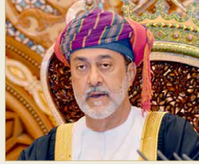
همد بن طارق

تلقي عاهل البلاد صاحب الجلالة الملك حمد بن عيسى آل خليفة، ورئيس الوزراء صاحب السمو الملكي الأمير خليفة بن سلمان آل خليفة وولي العهد نائب القائد الأعلى النائب الأول لرئيس مجلس الوزراء صاحب السمو الملكي الأمير سلمان بن حمد آل خليفة برفقيات شكر جوابية من ملكة المملكة المتحدة وإيرلندا الشمالية ورئيسة الكومنولث صاحبة الجلالة الملكة إليزابيث الثانية، رداً على برفقياتهن المهنئة بيوم ميلاد جلالتها.