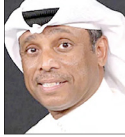
د. خالد حسن

أكد وكيل الثروة الحيوانية بوزارة الأشغال وشؤون البلديات والتخطيط العمراني الدكتور خالد أحمد حسن أن المسالخ العشوائية غير المرخصة توقفت عن الذبح استجابة للحملات التي نظمتها وكالة الثروة الحيوانية، مشيراً إلى تزويد وزارة الصحة بكتابة المخالفين كونها لجهة المعنية بتحويل المخالفين إلى النيابة العامة بموجب قانون الصحة العامة. وشدد حسن على أن الوكالة لم تعط أي تصريح هذا العام لأي مسلخ من غير المسالخ المعتمدة لذبح الأضاحي.