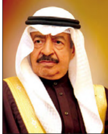
سمو رئيس الوزراء

ووجه سموه إلى تشكيل لجنة من ذوي الاختصاص لمراجعة القوانين والإجراءات التي تحكم آليات صرف الأدوية بالصيدليات الحكومية والخاصة، وتغليظ العقوبات على المخالفين والتأكد من مدى الالتزام بالاشتراطات الواردة في القوانين المنظمة لمزاولة مهنة الصيدلة والمراكز الصيدلية، ورفع تقريرها إلى مجلس الوزراء. ويأتي هذا الأمر في إطار ما يوليه صاحب السمو الملكي رئيس الوزراء حفظه الله من اهتمام بالرعاية الصحية وتحقيق أعلى مستويات الجودة المقدمة للمواطن والمقيم، والحرس على الالتزام بالقوانين والبروتوكولات التي تنظم عمليات صرف الأدوية بما لا يدع أي مجال للاستغلال أو التزوير وهدر الأموال العامة المخصصة لشراء الأدوية.